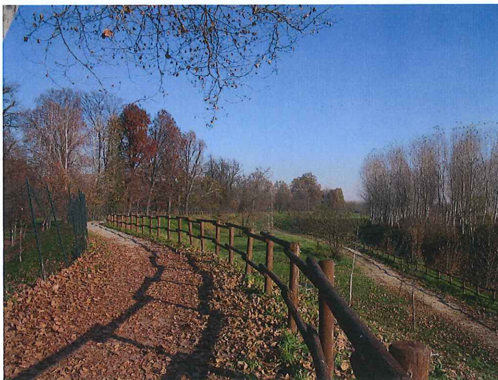
fot. 5: vista parco - post l lotto