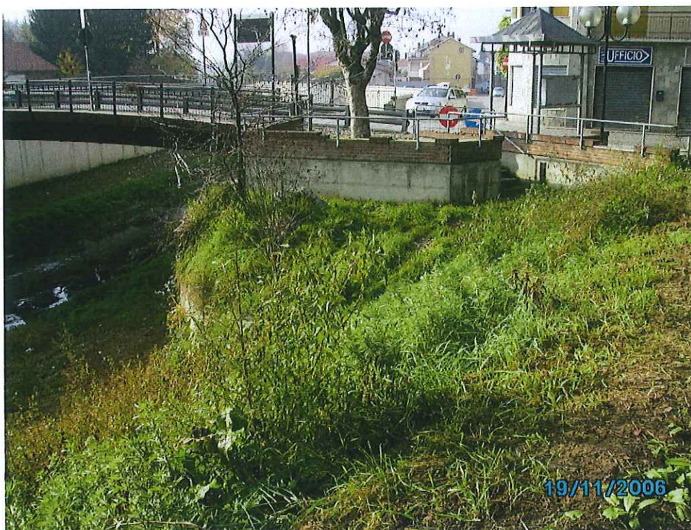
foto. 4: vista futura "piazzale portale" dallo stradino superiore - ante l'lotto