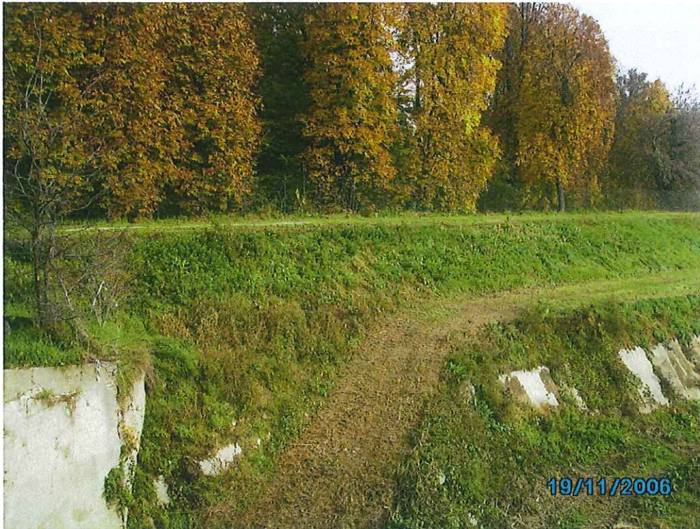
fot. 2: vista stradino inferiore dal ponte - ante I lotto