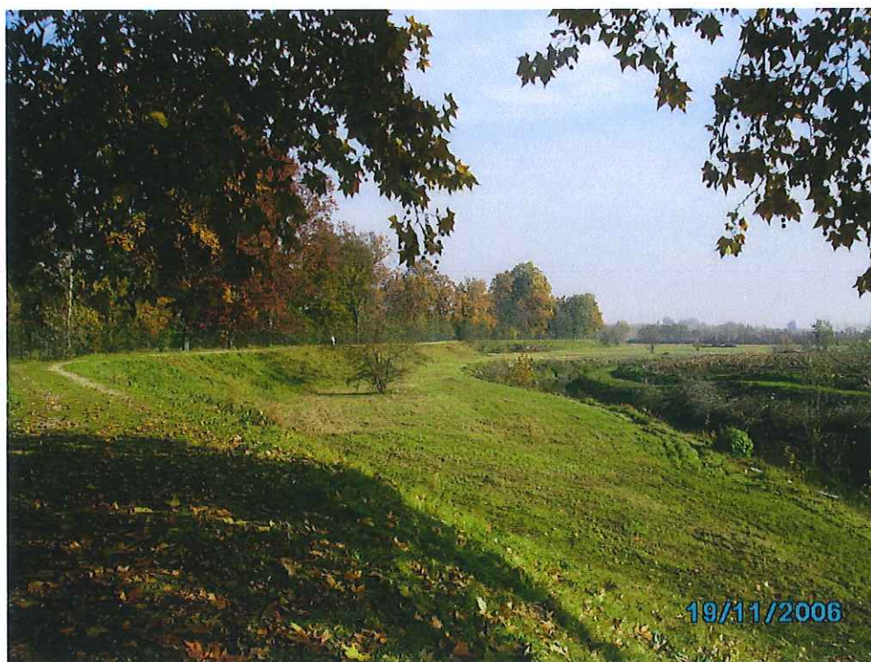
fot. 5: vista parco - ante l lotto