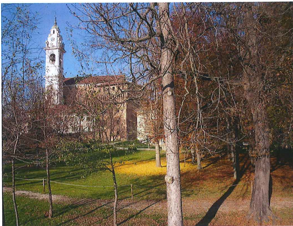
fot. 8: vista autunnale parco storico di pertinenza villa Cavour zona limitrofa all'ingresso al parco golenale