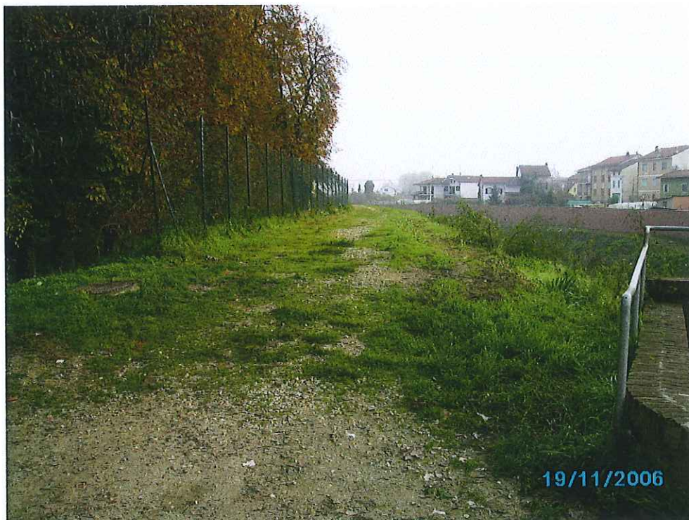
fot. 3: vista stradino superiore dalla piazza - ante l lotto