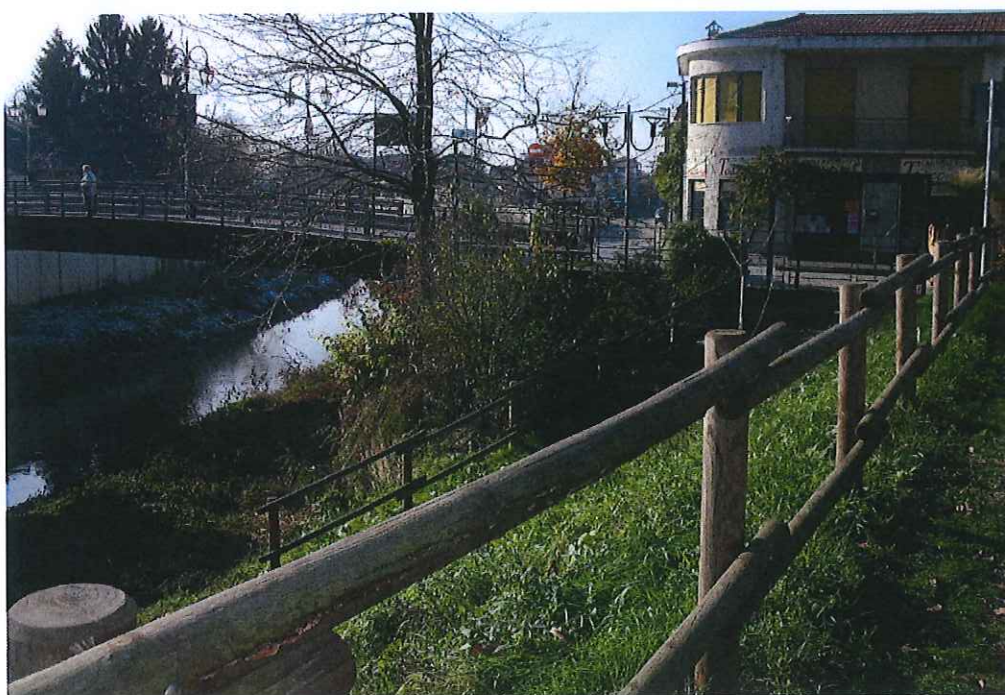
foto. 4: "piazzale portale" dallo stradino superiore - post l'lotto