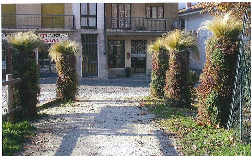
fot. 7: vista entrata al parco presso piazza portale - post I lotto particolare del verde verticale