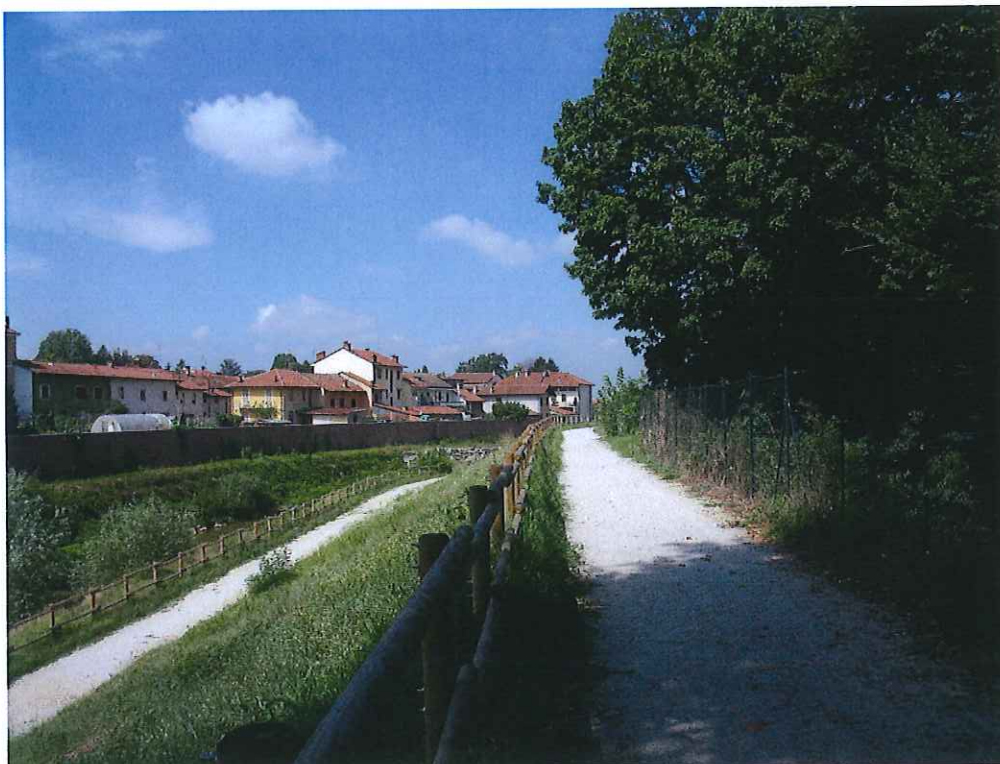
fot. 6: vista camminamenti superiore e inferiore - post I lotto