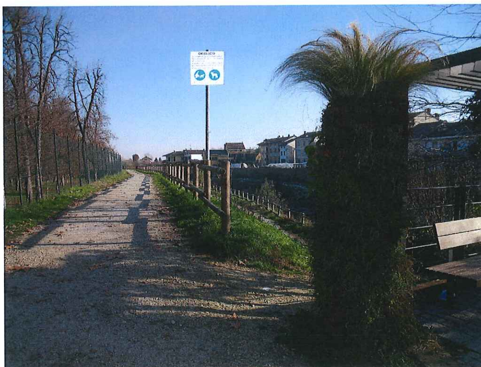
fot. 3: vista stradino superiore dalla piazza - post l lotto