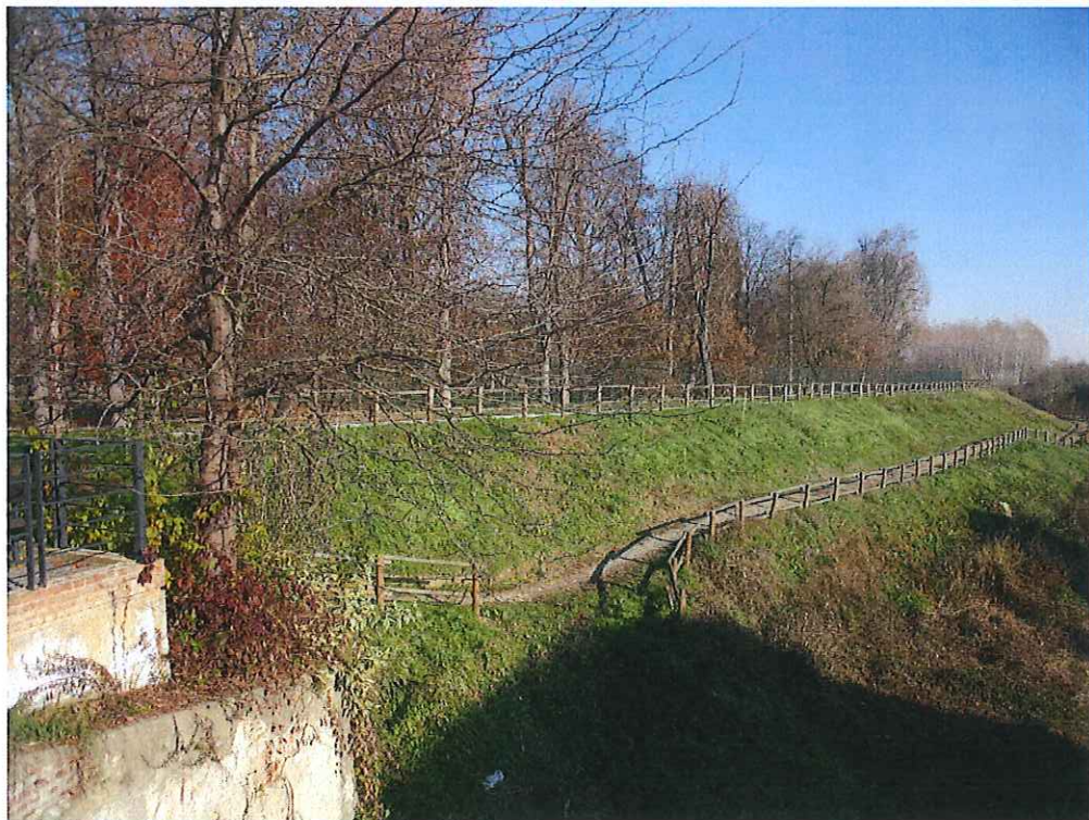
fot. 2: vista stradino inferiore dal ponte - post I lotto