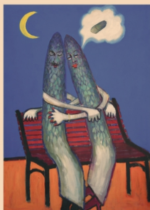
Autore: Franco Negro

Az. Agricola GARIGLIO Cascina Rubina, 30 - 10046 Poirino 3281840928 Punto Vendita Str. della Rezza 3- Chieri